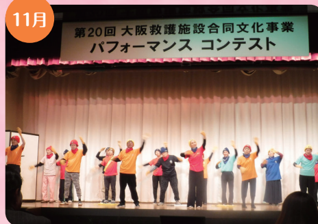
11月 第20回 大阪救護施設合同文化事業 パフォーマンス コンテスト 救護施設みなと寮が『パブリカ』のダンスで3位入賞!