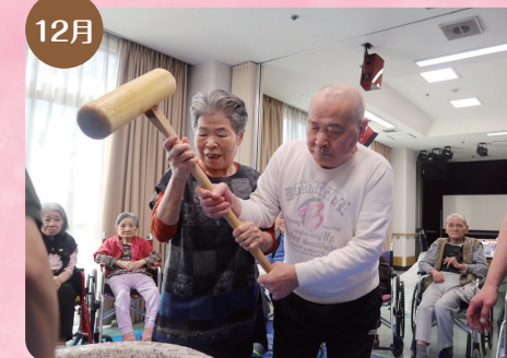
12月 ご夫婦で仲良くおもちゃつき