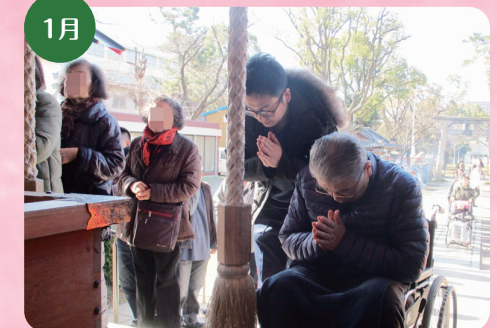
1月 港住吉神社へ初詣にでかけました。 今年1年もお元気で過ごされますように。