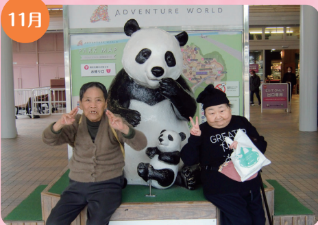
11月 野外生活訓練 ～南紀白浜方面へ～ パンダを見に行きました。