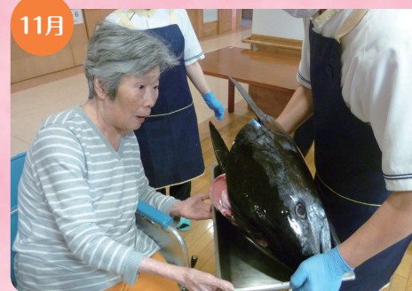
11月 マグロの解体ショー 大きなマグロにびっくり!