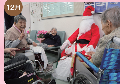
12月 今年も施設にサンタがやってきた